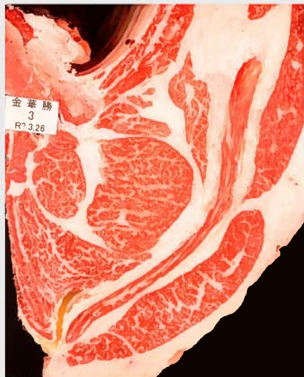
▲BMSNo. 7 □-入芯 55cm 2 母（華春福-百合茂）

■遺伝病《8項目（B3、F13、CL16、MCSU、CHS、MSHR、MOD、IARS）正常》