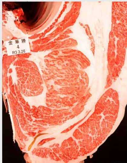
▲BMSNo. 10 □-入芯 70cm 2 母（秀幸福-金幸）