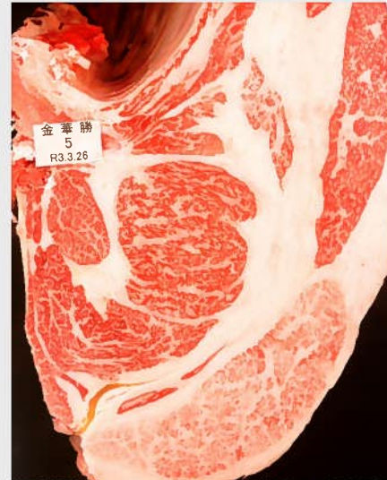
▲BMSNo. 8 □-入芯 61cm 2 母（華春福-忠茂勝）