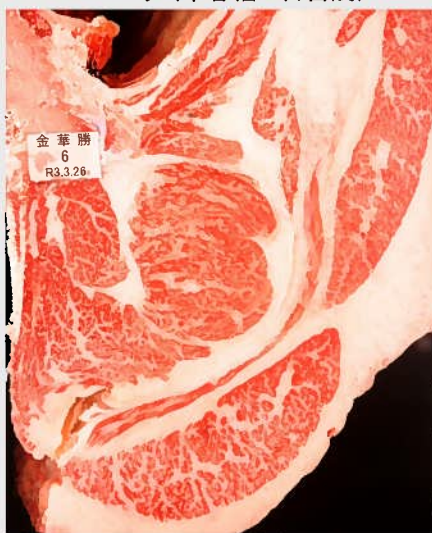
▲BMSNo. 8 □-入芯 63cm 2 母（秀幸福-勝忠平）