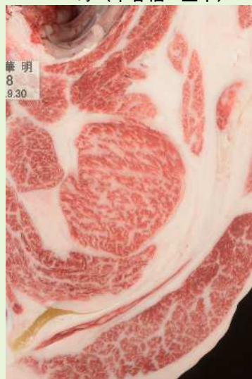
▲BMSNo. 8 □-入芯 54cm 2 母（華春福—喜亀忠）