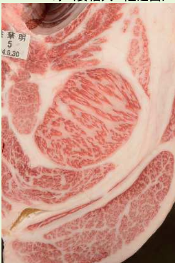
▲BMSNo. 8 □-入芯 79cm 2 母（百合茂—安福久）