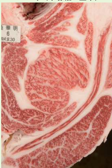
▲BMSNo. 9 □-入芯 65cm 2 母（喜亀忠—安福久）