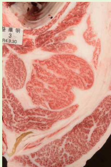
▲BMSNo. 9 □-入芯 66cm 2 母（華春福—百合茂）