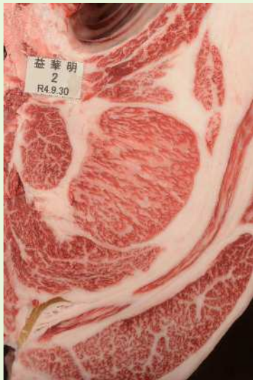
▲BMSNo. 9 □-入芯 70cm 2 母（華春福—金幸）