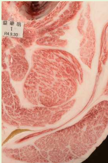
▲BMSNo. 12 □-入芯 75cm 2 母（安福久—隆之國）

■遺伝病《8項目（B3、F13、CL16、MCSU、CHS、MSHR、MOD、IARS）正常》