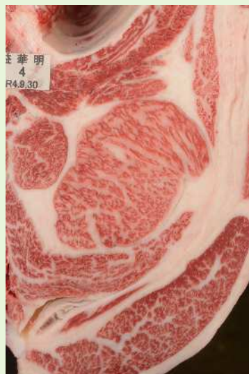
▲BMSNo. 10 □-入芯 77cm 2 母（華春福—金幸）