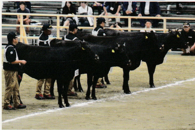
〈出品：肝属和牛育種組合〉