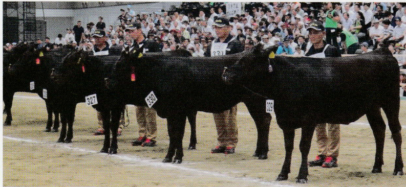
【種牛(雌牛)】 <出品: 肝属和牛育種組合>