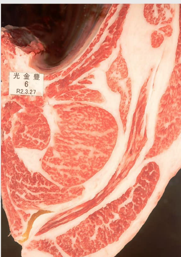
▲ BMSNo. 8 □-入芯 63cm² 母 (神徳福—平茂勝)