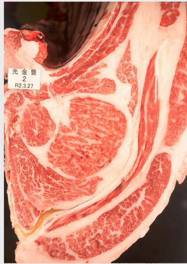
▲ BMSNo. 10 □-入芯 68cm² 母 (幸紀雄—第2平茂勝)