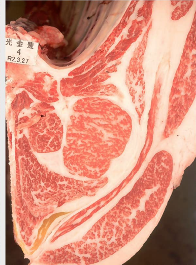
▲ BMSNo. 6 □-入芯 52cm² 母 (金幸—安糸福)