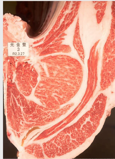
▲ BMSNo. 11 □-入芯 73cm² 母 (華春福—勝忠平)