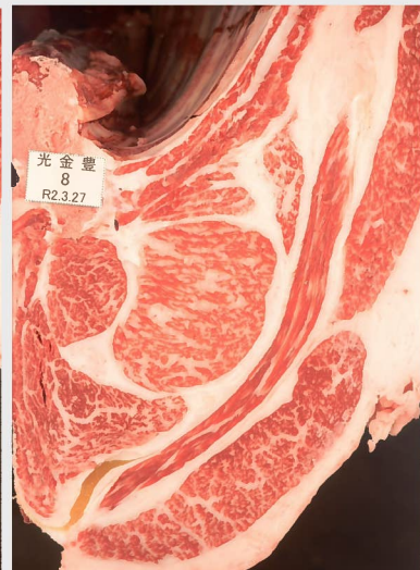
▲ BMSNo. 7 □-入芯 56cm² 母 (安糸福—神高福)