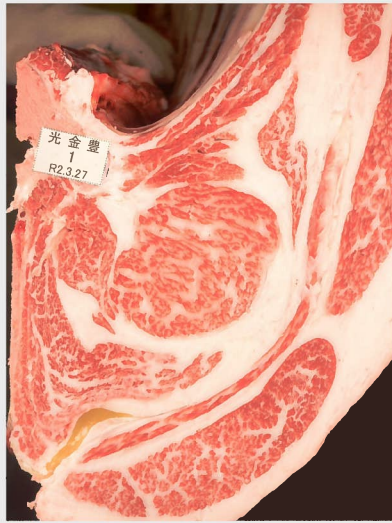
▲ BMSNo. 8 □-入芯 64cm² 母 (安福久—百合茂)

■ 遺伝病 《8項目 (B3, F13, CL16, MCSU, CHS, MSHR, MOD, IARS) 正常》