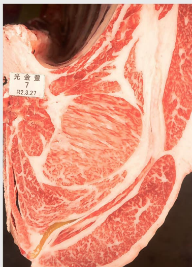
▲ BMSNo. 10 □-入芯 90cm² 母 (百合茂—安福久)