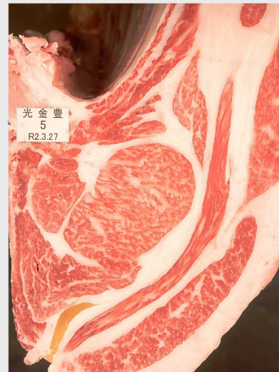
▲ BMSNo. 9 □-入芯 63cm² 母 (華春福—百合茂)